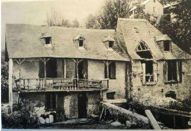
< Maison natale de Bernadette Son chapelet dans le petit oratoire