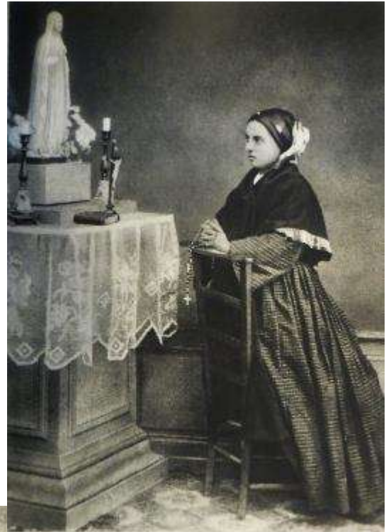
L'aise remplie des ineffables secrets, l'innocente Confidente de la Vierge égarée ses 'Chapelet' dans le petit oratoire.