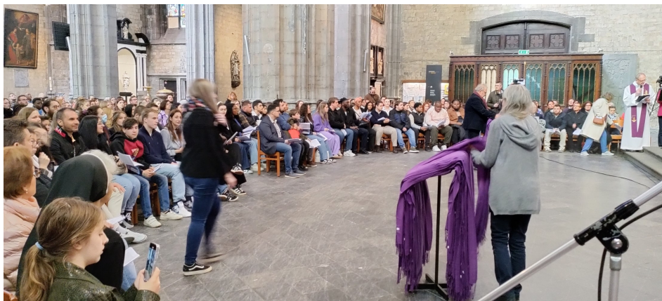
Photo : Appel décisif des catéchumènes en mars 2025, collégiale sainte Waudru