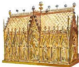
Châsse de Sainte Waudru

Extrait du Panégyrique de sainte Waudru lu par le Doyen de la Collégiale lors de la descente de la Châsse, la veille du dimanche de la Trinité où se déroule la Procession du Car d'Or qui véhicule les reliques de Sainte Waudru dans les rues de la Ville.