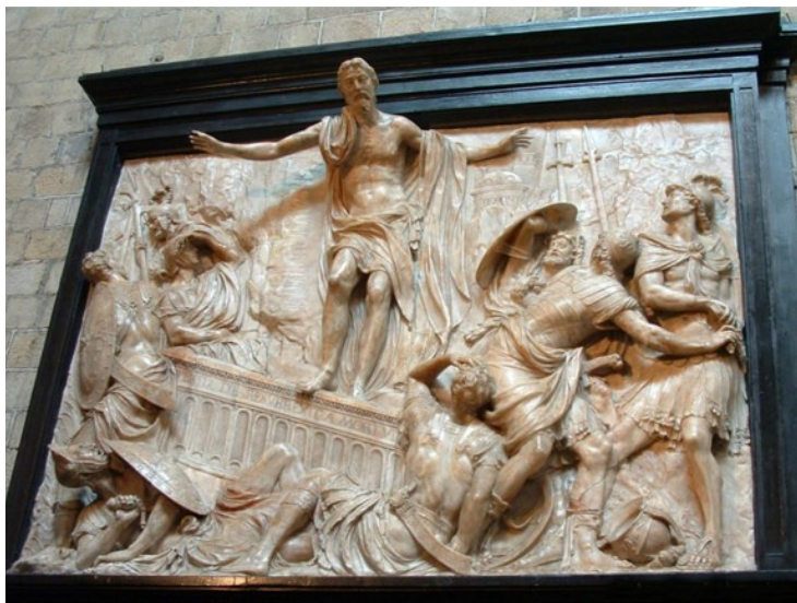
La résurrection du Christ, Jacques Du Broeucq (XVI e siècle), Collégiale Sainte-Waudru à Mons

On peut admirer à la Collégiale Sainte-Waudru une magnifique représentation de la Résurrection qui est l'œuvre de l'artiste montois Jacques Du Brœucq. Le Christ sort du cadre comme pour nous dire que rien ne peut le retenir dans son élan.