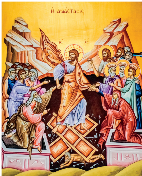
icône de la Résurrection

« Il fallait que Jésus ressuscite d'entre les morts »